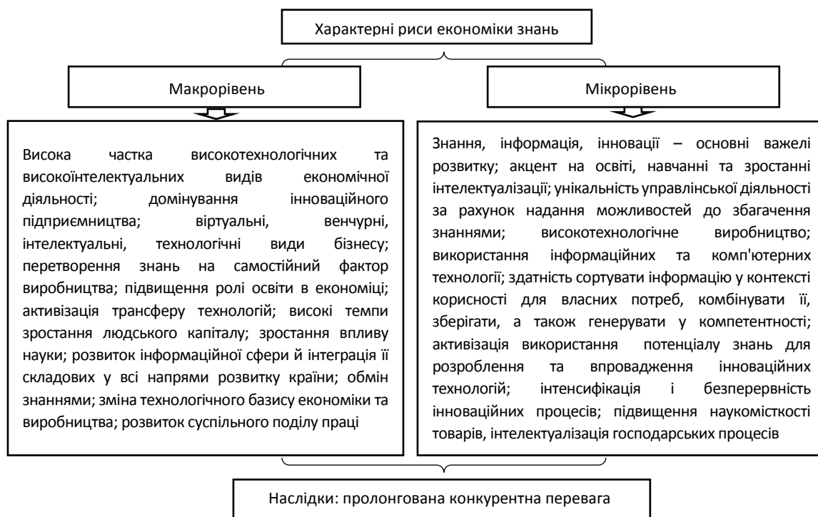
Рисунок 1 – Характерні риси економіки знань на різних рівнях управління